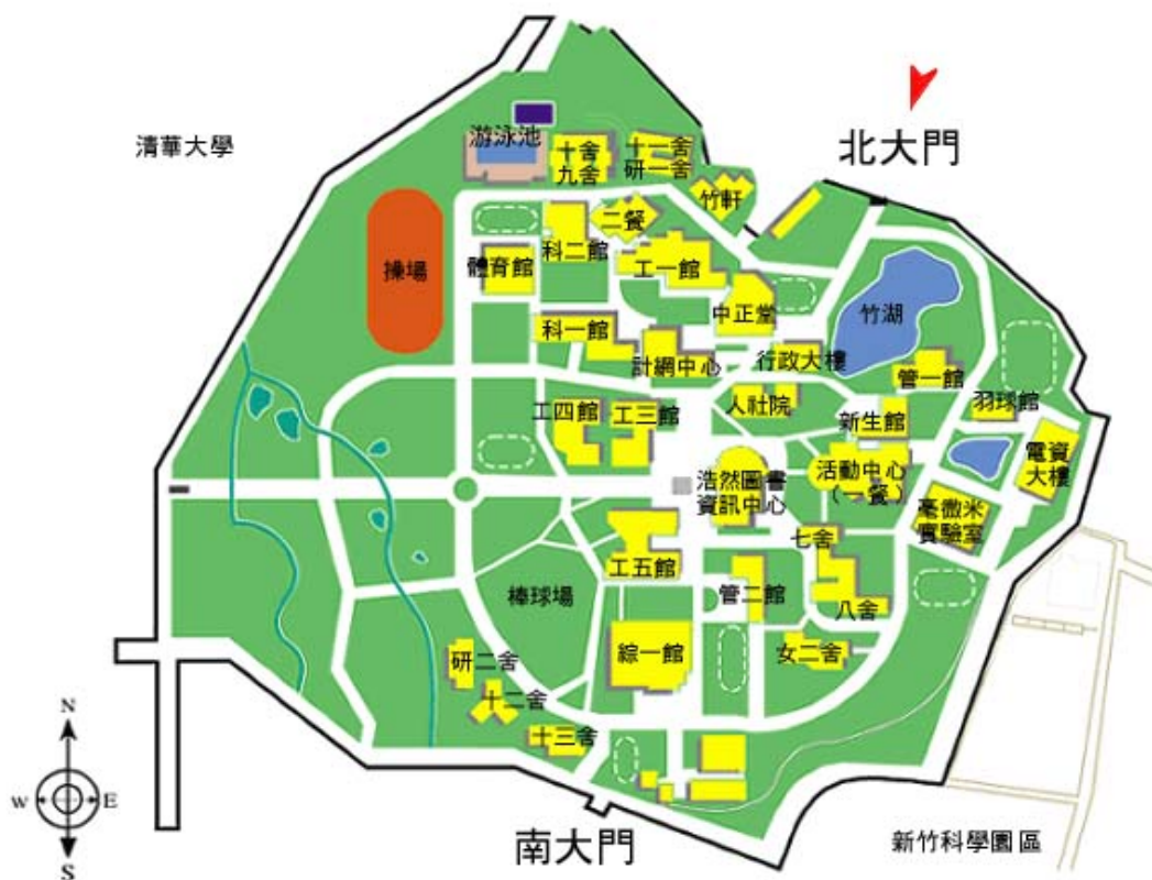
交大光復校區平面圖